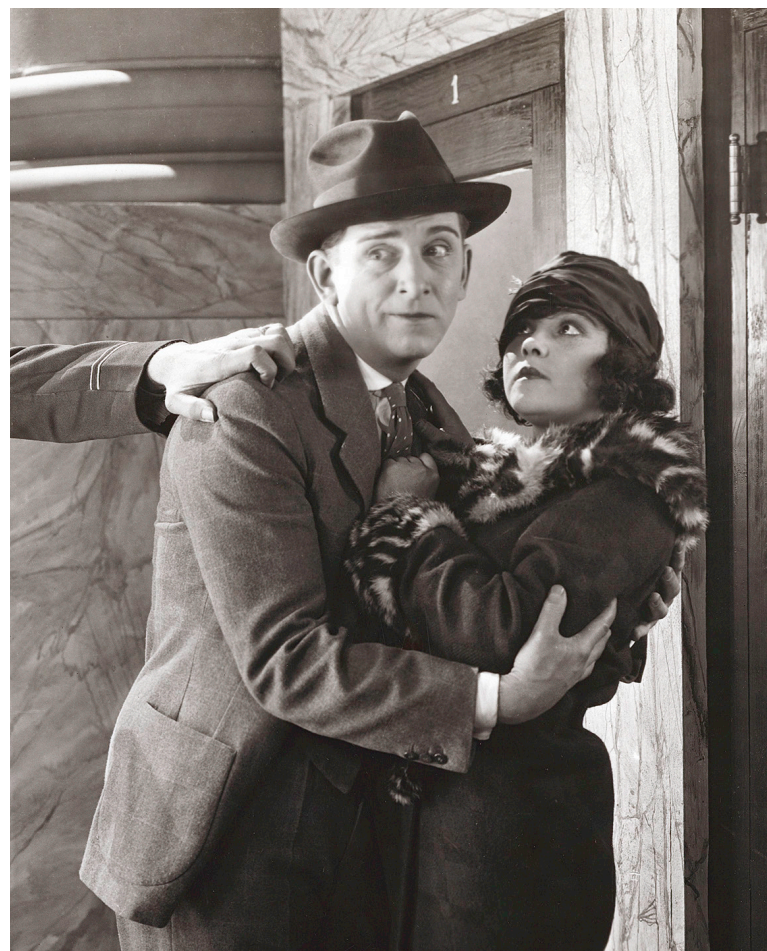
Poker Faces, 1926. Edward Everett Horton.