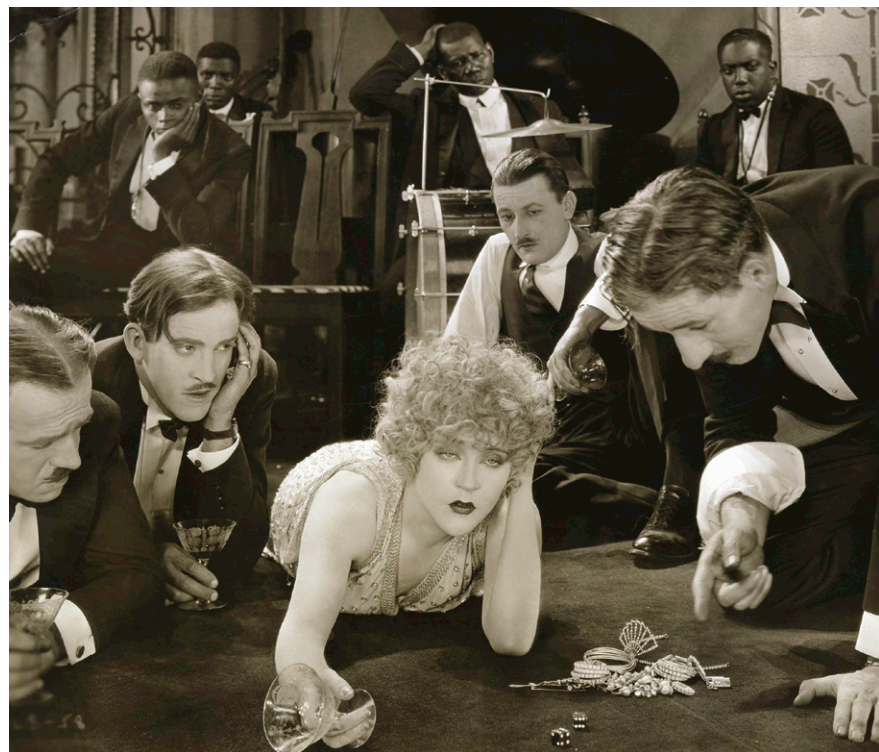
Circe the Enchantress, 1924. Mae Murray.