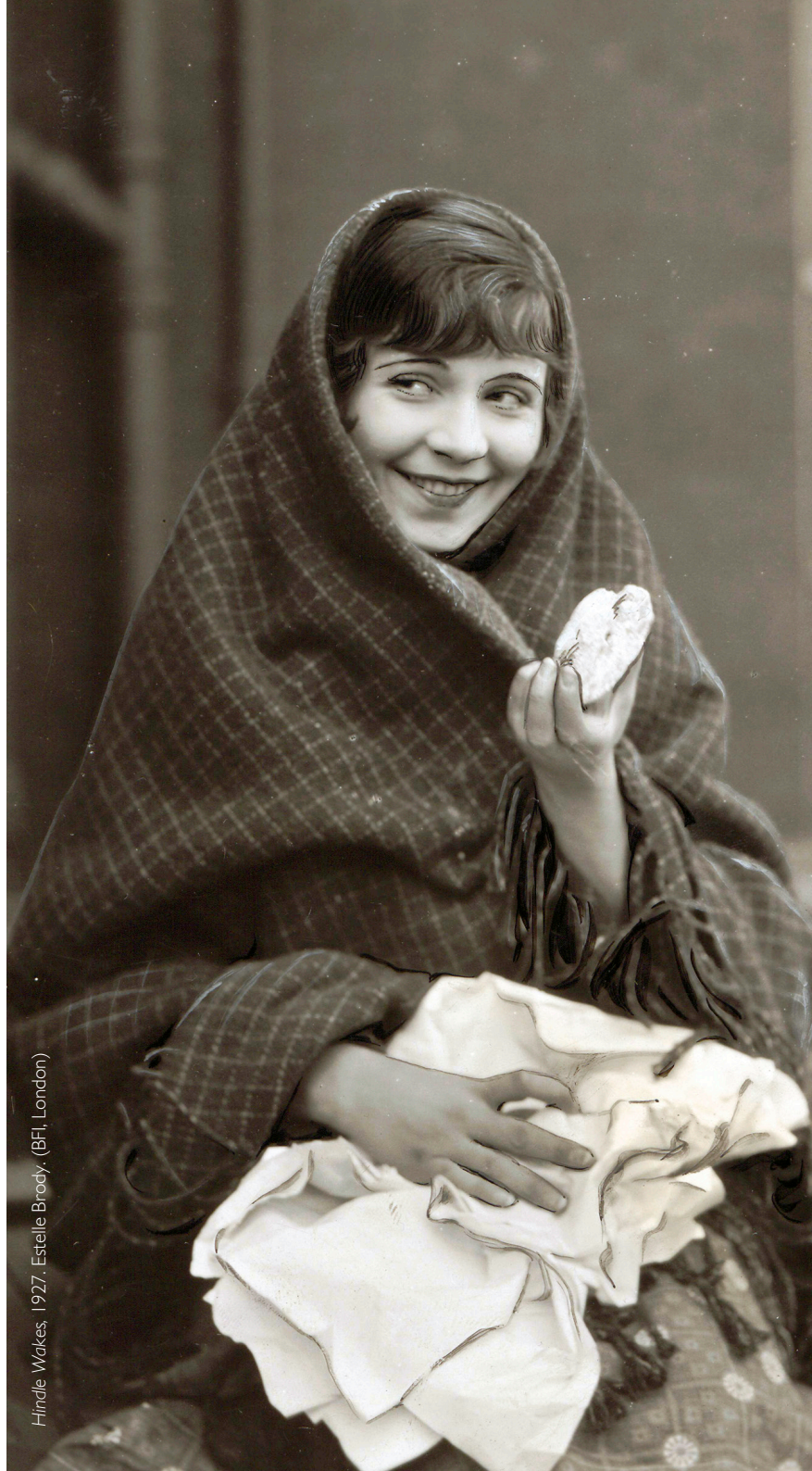
Hindle Wakes, 1927. Estelle Brody.

Una selezione di film della 42a edizione del festival è disponibile online. Informazioni e abbonamenti al programma online sono disponibili nella sezione dedicata sul sito delle Giornate.