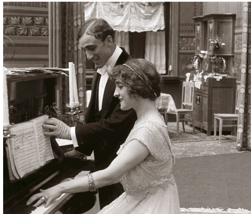
Ma l'amor mio non muore! , 1913. Gian Paolo Rosmino, Lyda Borelli (Museo Nazionale del Cinema, Torino)