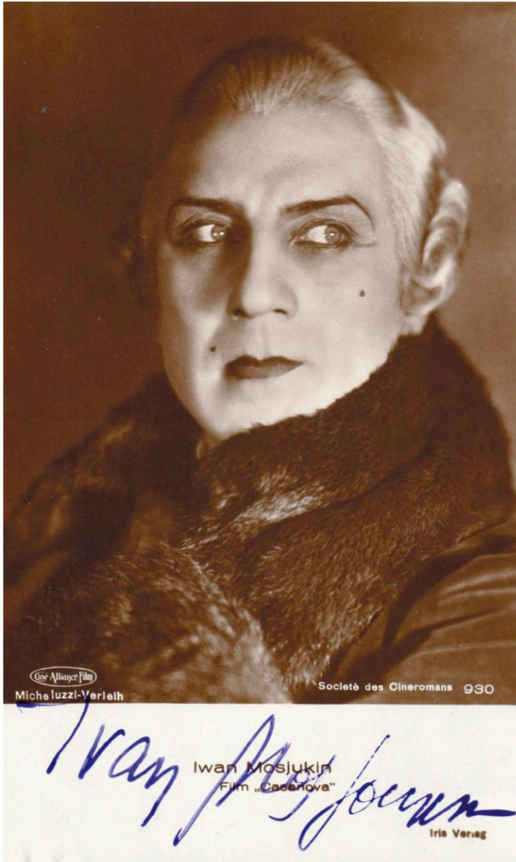
Casanova, 1927: Ivan Mosjoukine.