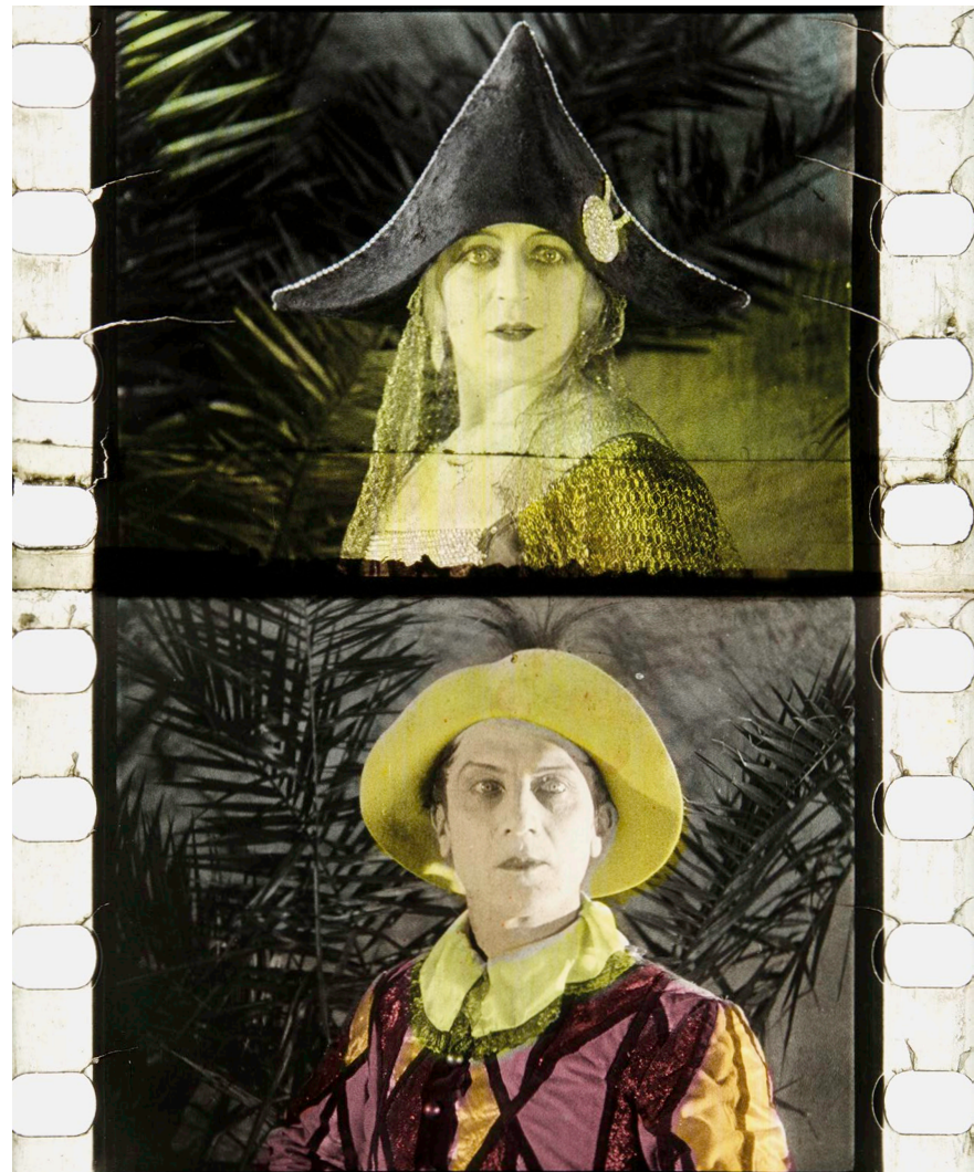
Casanova, 1927: Diane Karenne, Ivan Mosjoukine. From the stencil-colored safety print.