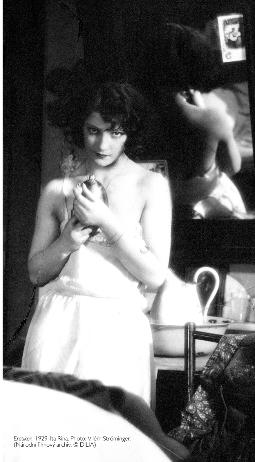
Erotikon , 1929: Ita Rina.

Una selezione di film della 40a edizione del festival è disponibile online. Informazioni e abbonamenti al programma online sono disponibili nella sezione dedicata sul sito delle Giornate.