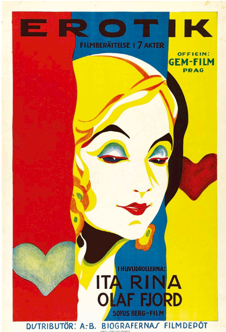
Erotikon , 1929. Poster svedese di / Swedish poster by J. Olséns.