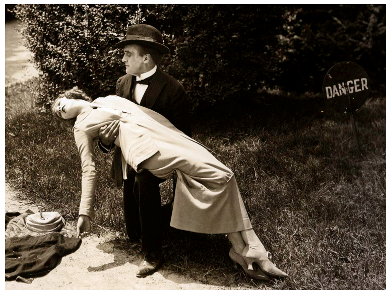
A Temperamental Wife , 1919: Constance Talmadge, Wyndham Standing. (MoMA, New York)