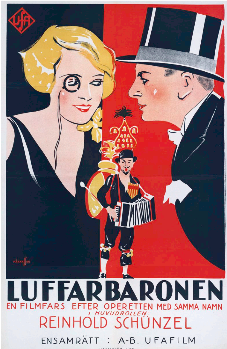
Der Juxbaron, 1927. Poster svedese di / Swedish poster by Gunnar Håkansson.