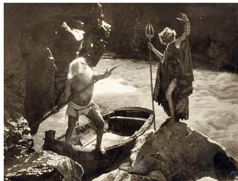
Maciste all'Inferno , 1926. (Museo Nazionale del Cinema, Torino)