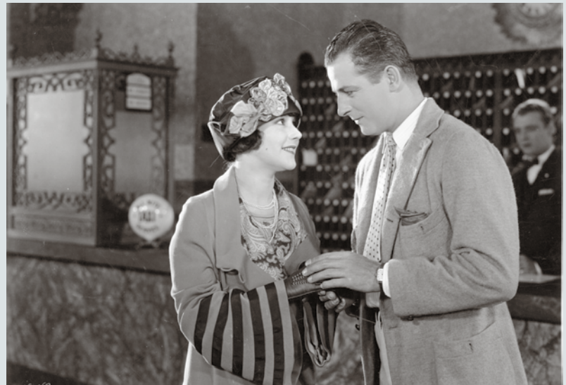
The Reckless Age , Harry Pollard, 1924.