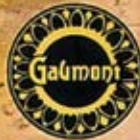
Le Railway de la Mort , Jean Durand, 1912.