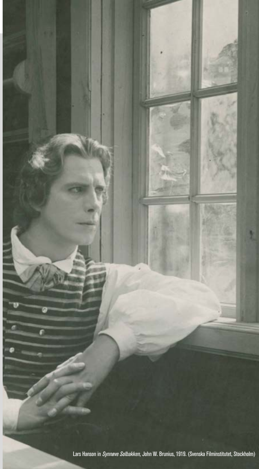
Lars Hanson in Synnave Solbakken, John W. Brunius, 1919.