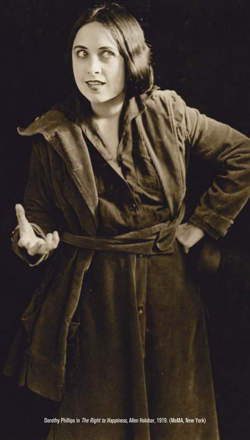
Dorothy Phillips in The Right to Happiness , Allen Holubar, 1919. (MoMA, New York)

Il Collegium si svolge dall'1 al 6 ottobre, dalle ore 13 alle 15, ed è ospitato presso la Sala Ridotto del Teatro Verdi; Le Pordenone Masterclasses si tengono dal 2 al 6 ottobre, dalle ore 11 alle 13, e sono anche esse ospitate presso la Sala Ridotto del Teatro Verdi. Il Collegium mira ad avvicinare al cinema muto, attraverso lezioni di approfondimento, le nuove generazioni. Le Pordenone Masterclasses puntano invece a raffinare e sviluppare la tecnica dell'accompagnamento per pianoforte dei film muti. L'ingresso a questi appuntamenti è libero.