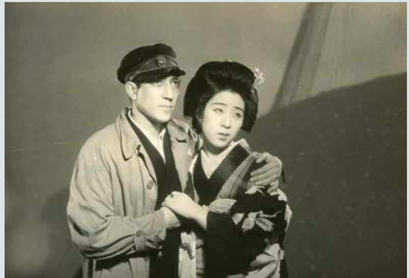
Shima no musume (La figlia dell'isola/The Island Girl), Hotei Nomura 1933. (National Film Centre, Tokyo)