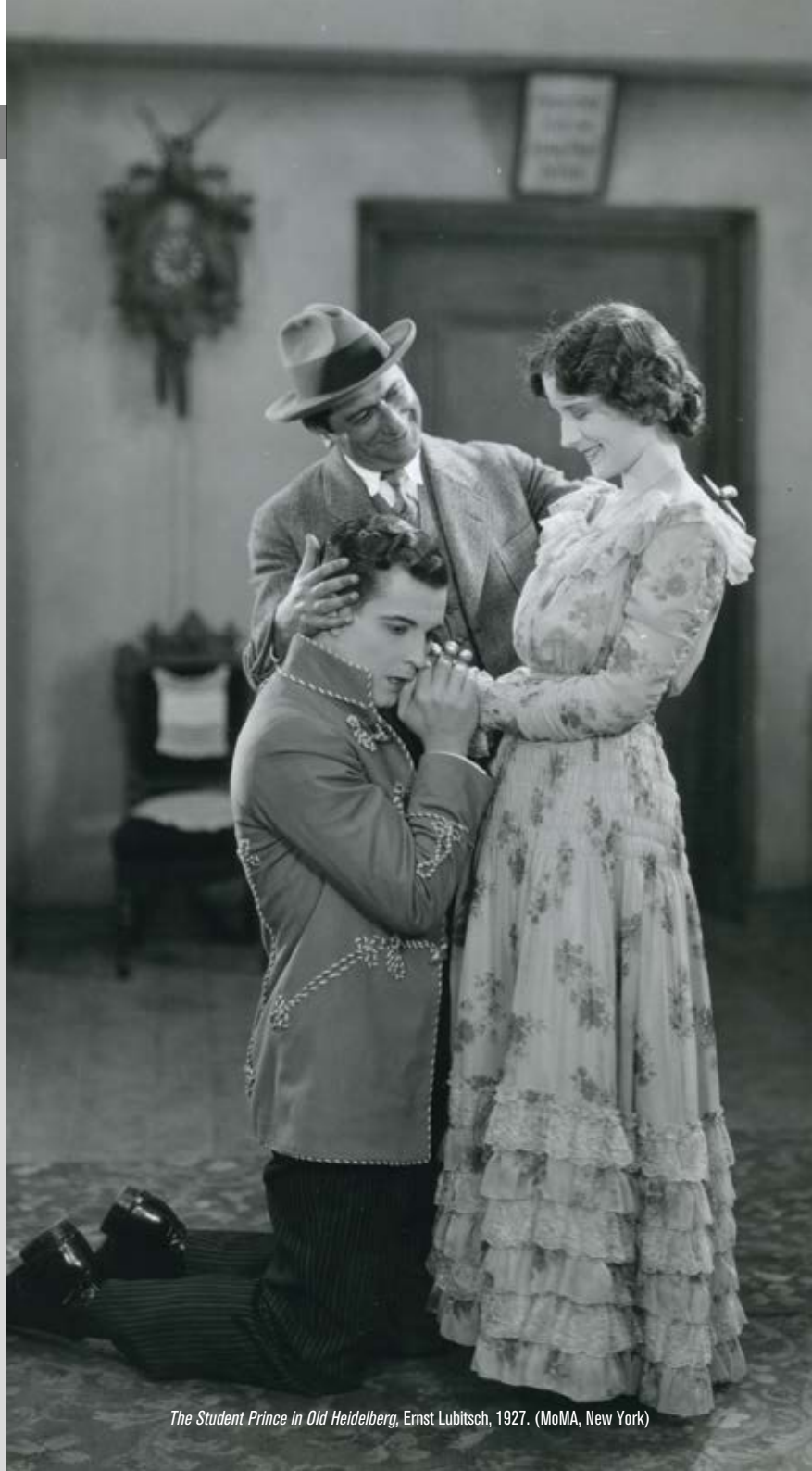
The Student Prince in Old Heidelberg , Ernst Lubitsch, 1927. (MoMA, New York)